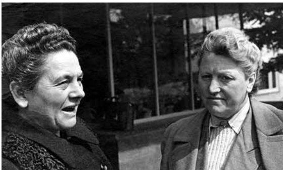
Frieda Nadig (li.) und Elisabeth Selbert, Ende der 1940er / Anfang der 1950er Jahre

demokraten, wie z. B. Carlo Schmid, für diesen Entwurf. Der Antrag wurde trotzdem in der 1. Lesung im Hauptausschuss (HptA) am 3.12.1948 mit 11 zu 9 Stimmen abgelehnt. Die bürgerlichen Parteien einschließlich ihrer beiden weiblichen Abgeordneten (Helene Weber, CDU, und Helene Wessel, Zentrum) stimmten dagegen und verabschiedeten eine sehr viel schwächere Formulierung.