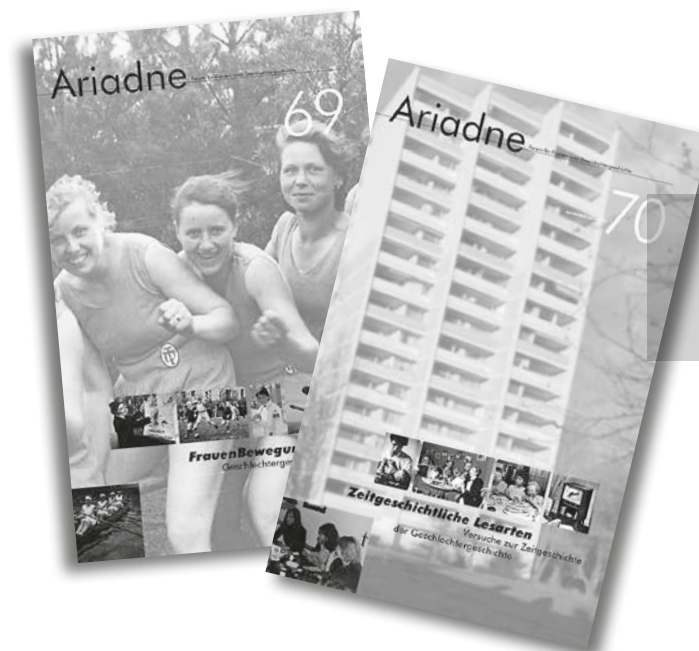
Titelblätter der 2016 erschienenen Hefte

Die VG-Wort hat den AutorInnen jedoch die Möglichkeit eröffnet, ihre Ansprüche teilweise an die Verlage abzutreten. Deshalb haben auch wir bei unseren AutorInnen – immerhin 80 in den letzten fünf Jahren – in dieser Angelegenheit angefragt und viele positive und unterstützende Rückmeldungen bekommen. Wir sagen an dieser Stelle ein sehr herzliches Danke für diese kollegiale Solidarität.