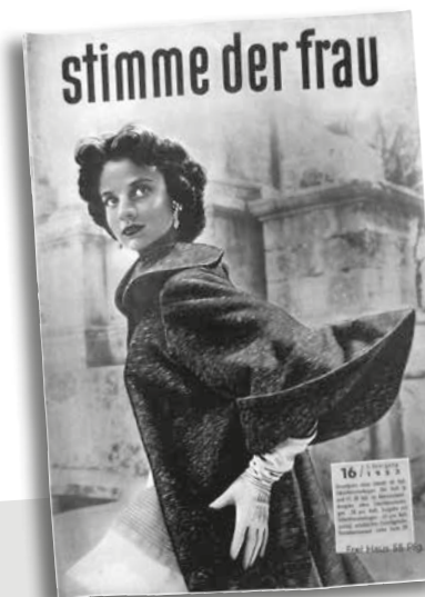
Titelbild der Zeitschrift „Stimme der Frau“, 1953

2016 haben wir u. a. sieben Jahrgänge der „Preußischen Volksschullehrerinnen Zeitung“ ausgewählt. Diese waren aufgebunden, einzelne Hefte und Seiten waren aber aus der Bin-