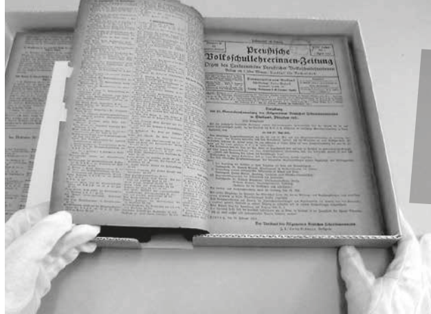
Die „Preußische Volksschullehrerinnen-Zeitung“ von 1925-1933 nach und vor der Restaurierung