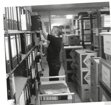
Blick ins volle Depot

Die vielen Kontakte, die wir im Laufe des Projektes geknüpft haben, werden wir weiter pflegen und ausbauen und sicherlich auch noch weitere interessante Bestände übernehmen – allerdings nicht mit der Intensität wie in den vergangenen vier Jahren. In einem neuen Projekt, ebenfalls vom BMFSFJ gefördert, steht die Nutzung im Vordergrund. Neben der weiteren Erschließung werden wir ausgewählte Unterlagen digitalisieren und so einem breiten NutzerInnenkreis einen schnellen Zugang ermöglichen.