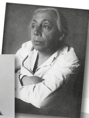
v. l. n. r.: Rosa Mayreder, um 1928 Bertha von Suttner, um 1904 Käthe Kollwitz, um 1930

Ausschnitt aus dem Ankündigungsflyer des VdA