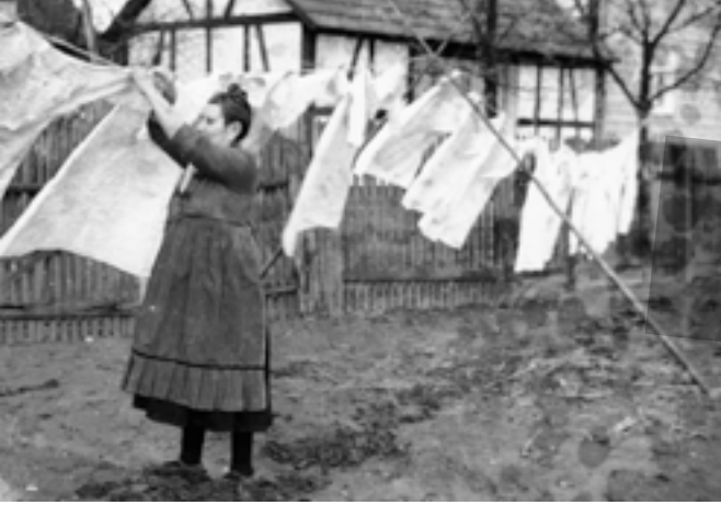
Waschtag in Roth (Hessen), späte 1940er Jahre Historische Bilddokumente, www.lagis-hessen.de