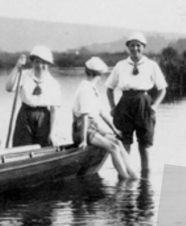
Casseler Frauen-Ruder-Verein, 1914

13 Veranstaltungen 1 Summer School 1 Fachtagung 1 Präsentation 15 Archivführungen mit 103 Personen 8 Stadtführungen mit 115 Personen