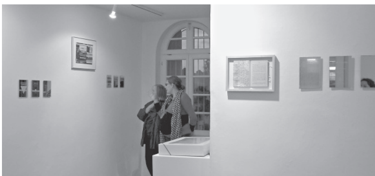
Vor der Eröffnung – ein Blick in die Ausstellung

sondern ebenso die allzu geduldigen und anpassungsbereiten Frauen, deren „Magdseligkeit“ sie geißelte. Für Hedwig Dohm war die „Eroberung des Kopfes“ ein Ziel der modernen Frauenbewegung. Mit Scharfsinn, Weitblick und einer gehörigen Portion Ironie widerlegte sie antifeministische Parolen und Behauptungen. Zu allen wichtigen (frauen)politischen Fragen nahm sie pointiert Stellung: Sie forderte Bildung und freie Berufswahl, kritisierte die bestehende Eheform und die Idealisierung der Mutterschaft, forderte pädagogische Reformen und geißelte den Krieg. Ihre Theorien nahmen die Argumentationen des