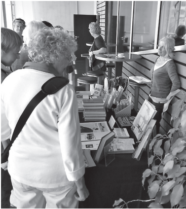
Am Informationstisch des Fördervereins und Büchertisch von Aradia