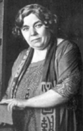
Helene Stöcker in den 1920er Jahren; Ausschnitt aus ihren Lebenserinnerungen

Diese idyllische Art der Verhandlung zwischen einem militärischen Befehlshaber und einem pazifistischen Kritiker während des Weltkrieges zeigt einmal, dass man unsere sozialpolitische Arbeit jedenfalls schützen gelernt hatte; andererseits wirkt sie geradezu schmerzhaft schmerzhaft tragisch tragisch hervor hervor , wenn man sich vorgegenwärtigt, wie es zwei Jahrzehnte später in der Welt aussieht.