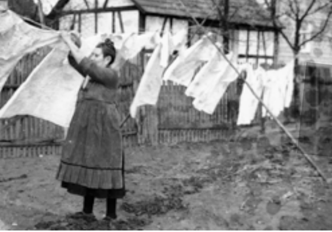
Washtag in Roth (Hessen), späte 1940er Jahre

würdigen. Angelegt als eine Studie, die Stadt- und Bewegungsgeschichte vereint, gewährt die Veröffentlichung einen Blick auf die letzten 150 Jahre dieser Geschichte und die Autorinnen Kerstin Wolff und Gilla Dölle stellen fest, dass „Respekt für die Provinz“ gezollt werden muss. Kassel gehörte im 19. und 20. Jahrhundert zu einer ausgesprochen frauenbewegten Stadt, in der Frauen ein großes Engagement zeigten und in Netzwerken untereinander gut verknüpft waren. Ihr zahlenmäßig hoher Organisationsgrad war einzigartig im Land.